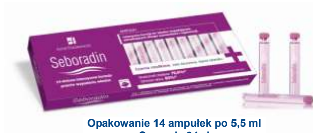
Opakowanie 14 ampulek po 5,5 ml Cena ok. 34 zł