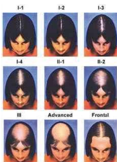
Rys. Skala Ludwiga

Dermatolodzy na podstawie obrazkowych plansz swoich pacjentów stworzyli tzw. Skalę Ludwiga, na podstawie której można stwierdzić w którym stadium choroby jest pacjentka oraz jak może dalej przebiegać jej choroba. Skala Ludwiga służy do oceny stopnia nasilenia łysienia. Bardzo istotne jest, aby jak najszybciej zahamować proces łysienia androgenowego, ponieważ jest to zjawisko nieodwracalne.