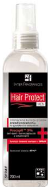
Spray Hair Protect Men