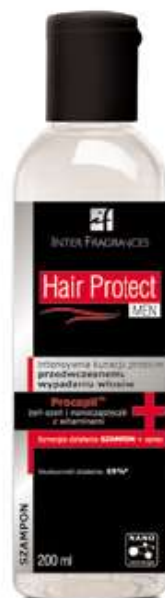
Szampon Hair Protect Men